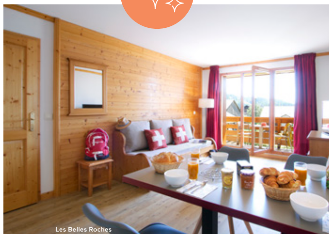
Les Belles Roches